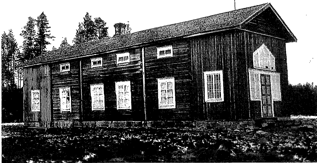
Suojeluskunnan talo Vainionpäänloukolla.

Ampumahiihto eli hiihtoammunta sopi mainiosti suojeluskuntajärjestöjen urheiluohjelmaan. Siinä yhdistyivät tärkeät maanpuolustuksen perusasiat, hiihto ja ammunta. Ampumahiihto toi vaihtelua myös tavalliseen ampumaharrastukseen. Ampumahiihto sai Suomessa alkunsa puolustusvoimien ja suojeluskuntien kisoista. Aluksi kilpailijoiden paremmuus ratkaistiin hiihdossa ja ammunassa erikseen, vaikka ammunnat tapahtuivatkin hiihtotaipaleiden välissä, kunnes vuonna 1926 siirryttiin yhteispisteytykseen. Alkuvuosina aseensa sai valita vapaasti, mutta vuodesta 1925 sallittiin vain suojeluskuntajärjestön viralliset kiväärit. Sittemmin kivääreiksi vakiintuivat "lotta-kivääri" ja "pystykorva". Ammunnat suoritettiin makuulta ja tauluina olivat joko pää- tai rintakuviot. Ampumatkat saattoivat olla epämääräisiä, joten haastetta kilpailijalle aiheutti matkan arvioi-